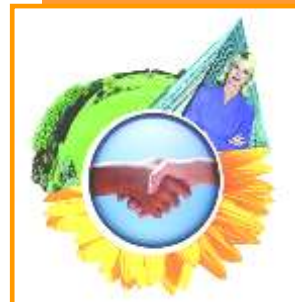
Schéma d'intervention Système de Management de la Qualité

Vous souhaitez faire accompagner votre établissement ou votre association dans la mise en place d'un Système de Management Qualité. Vous voulez être guidé dans vos choix, éviter le temps perdu, bénéficier d'un appui auprès de vos équipes, ou encore faciliter la mise au point des outils qui vous permettront d'être efficace. Contactez-nous, suite à un état des lieux, un plan d'actions efficace et pragmatique vous permettra d'aborder ce nouveau challenge dans les meilleures conditions.